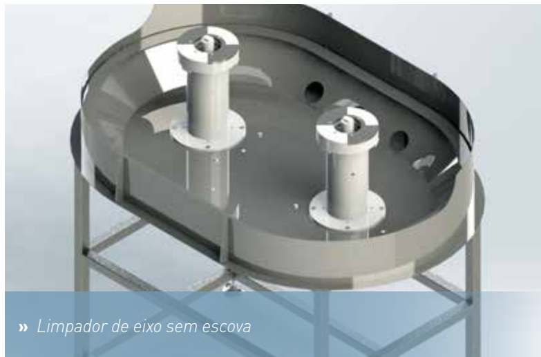
» Limpador de eixo sem escova